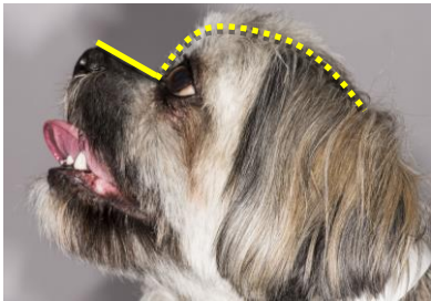
Figuur 3. Zichtbaar oogwit bij de alerte, recht naar voren kijkende hond (kwadranten gearceerd)